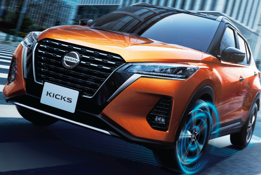
Photo:X ツートーン インテリアエディション。ボディカラーはプレミアムホライズンオレンジ (PM)/ピュアブラック(PM)2トーン(特別塗装色82,500円)。オプション装着車。