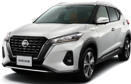
Photo:X ツートーン インテリアエディション。ボディカラーはボディカラーはプリアットホワイトパール(3PM)(#QAB)(特別塗装色38,500円)。内装色はオレンジタン<G>。オプション装着車。