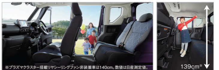
※プラスマクラスター搭載リヤシリングファン非装着車は140cm。数値は日産測定値。 139cm*

広さに驚き! まるでリビングみたいな広い空間。 乗り込むだけで、みんなの笑顔が輝きだします。