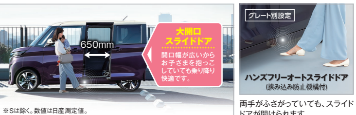
※Sは除く。数値は日産測定値。 650mm

使いやすさに感心! ハンズフリー*で大きく開くスライドドアだから、乗り降りがスムーズ。