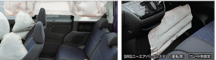
SRSニーエアバッグシステム(運転席) グレード別設定

SOSコール(ヘルプネット) グレード別設定 高性能の位置情報、センサー情報とともに 専門のオペレーターにつながる。 急病時や危険を感じたときには、SOSコールスイッチを押しください。万が一の事故発生時には、エアバッグ展開と連動し自動通報されます。専門のオペレーターが警察や消防への連携をサポートします。自車位置や所有車の情報が自動的に連絡されます。 【事故や急病時など】 手動(ワンタッチ)で通報 自動的に通報 専用スイッチによる通報 エアバッグ展開に連動して自動的に通報。